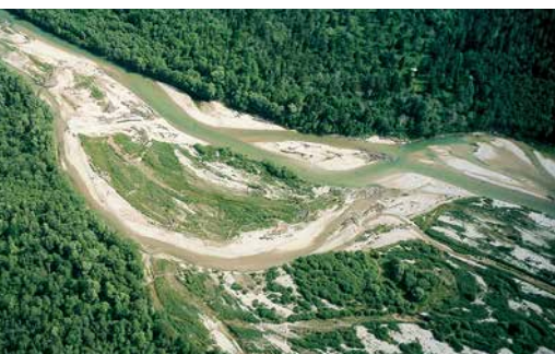
Die Pupplinger Au aus der Vogelperspektive

Doch die Natürlichkeit der Pupplinger und Ascholdinger Au ist trügerisch. Denn seit dem Bau des Sylvensteinspeichers sind die Hochwasserwellen seltener geworden und die Gestaltungskraft der Isar gemindert. Da zudem die früher praktizierte Streumahd und die Waldweide im letzten Jahrhundert weitgehend eingestellt wurden, setzte eine Verbrachung der Aue ein, die in Form einer dichten Decke aus Altgrasfilz den Fortbestand der Schneeheide-Kiefernwälder bedroht.