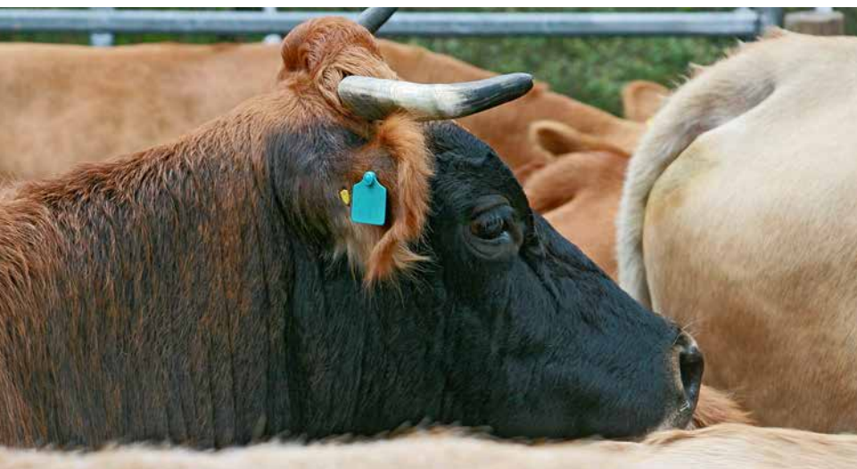
Murnau-Werdenfeler Kuh mit charakteristischer schwarzer Hornspitze

Das Beweidungsprojekt sichert damit nicht nur die hohe Artenvielfalt in der Pupplinger Au, es leistet einen nicht minder wichtigen Beitrag zur Erhaltung alter Nutztierassen und ist deshalb ein hervorragendes Beispiel für die Umsetzung der Bayerischen Biodiversitätsstrategie.