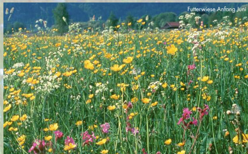
Futterwiese Anfang Juni