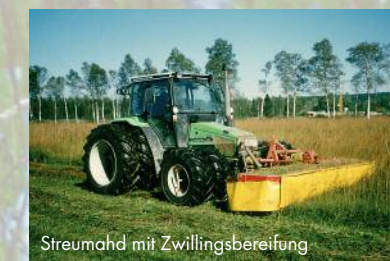
Streumähd mit Zwillingbereifung

Die Bauern pflegen die Kulturlandschaft bis heute: Werden Feucht- und Streuwiesen nicht gemäht, siedeln sich nach und nach wieder Bäume an und die Niedermoorlandschaft bewaldet sich aufs Neue.