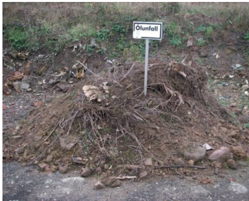
Abb. 1: Kontaminierter Bodenaushub nach Kfz-Unfall (mit natürlichem Organikgehalt)