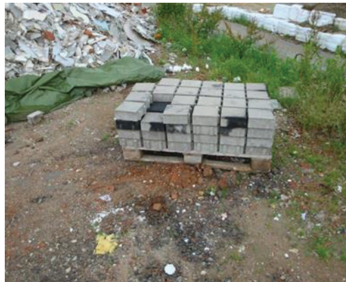
Abb. 2: Rückbau einer versiegelten Fläche nach Ölwanenschaden eines Kfz

Bei Schadensfällen wie Kfz-Unfällen, Maschinen- und Fahrzeugschäden, unsachgemäßen mobilen Betankungsvorgängen etc. treten häufig verhältnismäßig geringe Mengen an Öl, Hydrauliköl oder Kraftstoffe aus. Der Boden oder die Oberfläche um die Schadensstelle muss in der Regel großräumig abgetragen werden.