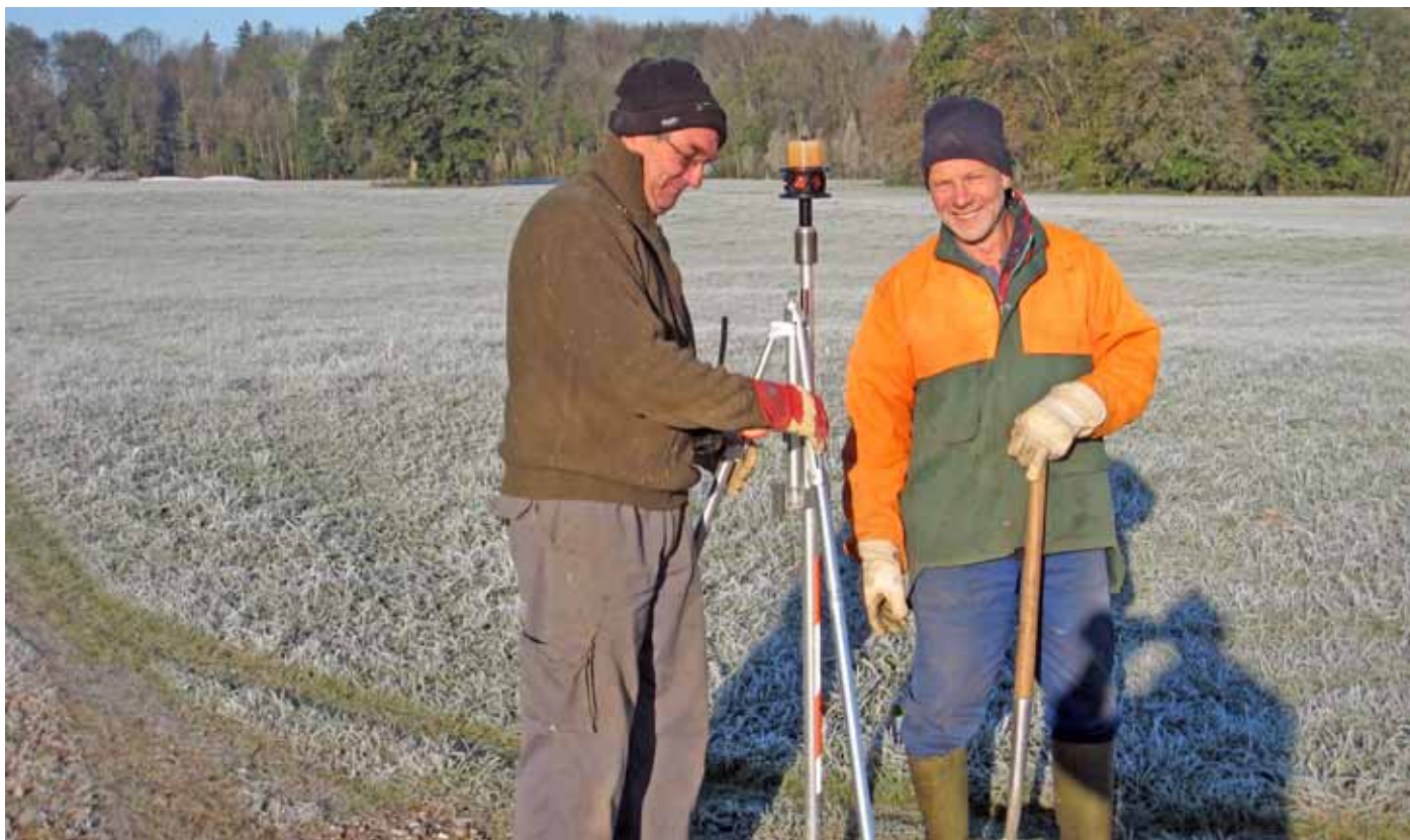
Absteckung der neuen Grenzen in Untersteinbach

In der Flurneuordnung Untersteinbach wurden im Jahr 2009 topographische Strukturen aufgemessen, die in die Verhandlungen zur Neueinteilung der Flurstücke eingeflossen sind. Diese Verhandlungen waren die Grundlage für die Berechnungen der Neueinteilung der Flurstücke. Die neuen Flurstücke wurden im Gelände abgesteckt und mit Grenzzeichen abgemerkt. Das Amt für Ländliche Entwicklung hat die Besitzeinweisung zum 01.02.2010 erlassen. Ab diesem Zeitpunkt können die Landwirte die neuen Grundstücke bewirtschaften. Der Wegebau und eine Pflanzaktion sind für das Jahr 2010 vorgesehen.