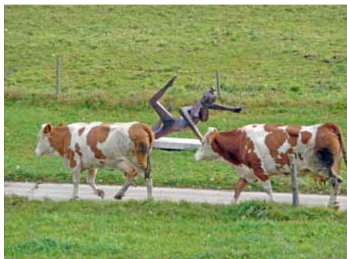
Kühe auf der „Happerger Kunstmeile“

Für Februar 2010 ist eine Teilnehmerversammlung vorgesehen, in der die Ergebnisse der Wertermittlung vorgestellt werden. Im Jahr 2010 sind die Verhandlungen mit den Teilnehmern zur Neuverteilung der Grundstücke vorgesehen. Die Neuverteilung selbst wird voraussichtlich noch im selben Jahr erfolgen können.