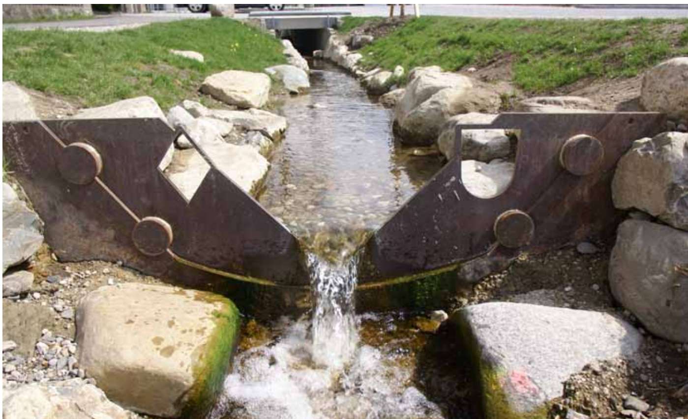
Thomson-Wehr am Dorfbach in Bichl; links eingestanzt das Emblem der Ländlichen Entwicklung, rechts eine Wappenform als Symbol für die Gemeinde

Die Dorferneuerung in Bichl steht nun vor den abschließenden Maßnahmen: der Platz am Kirchbichl soll umgestaltet werden, für die historischen Hausnamen werden Emailleschilder bestellt und an die Dorfchronik wird der letzte Schliff angelegt. Ein wichtiges Anliegen der Dorferneuerung ist zudem die Förderung der gemeindlichen Begegnungsstätte im neuen Gemeindezentrum mit Vorhaltung eines Gemeindesaales im Bayerischen Löwen. Nach Abschluss der Maßnahmen werden die teilweise geänderten Grenzen neu vermessen und die erforderlichen Eigentumsübergänge mit Vereinbarungen geregelt. Im Jahr 2009 wurde in einem feierlichen Festakt die fertig gestellte Dorfstraße mit Bachöffnung und Brunnenanlage eingeweiht.