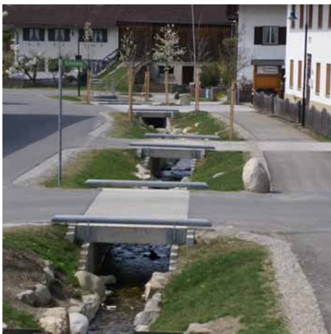
Der neugestaltete Bachlauf in Bichl

Die Dorferneuerung in Bichl steht nun vor den abschließenden Maßnahmen: der Platz am Kirchbichl soll umgestaltet werden, für die historischen Hausnamen werden Emailleschilder bestellt und an die Dorfchronik wird der letzte Schliff angelegt. Ein wichtiges Anliegen der Dorferneuerung ist zudem die Förderung der gemeindlichen Begegnungsstätte im neuen Gemeindezentrum mit Vorhaltung eines Gemeindesaales im Bayerischen Löwen. Nach Abschluss der Maßnahmen werden die teilweise geänderten Grenzen neu vermessen und die erforderlichen Eigentumsübergänge mit Vereinbarungen geregelt. Im Jahr 2009 wurde in einem feierlichen Festakt die fertig gestellte Dorfstraße mit Bachöffnung und Brunnenanlage eingeweiht.